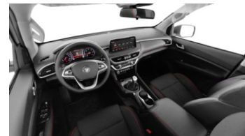
INTERIOR DE LUJO