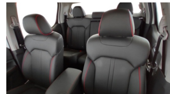
ASIENTOS DE CUERO

Limpiaparabrisas frontal con sensor de lluvia Faros delanteros con sensor para encendido automático Aros y llanta, aleación Premium 265 / 60 R18 Barra Antivuelcos